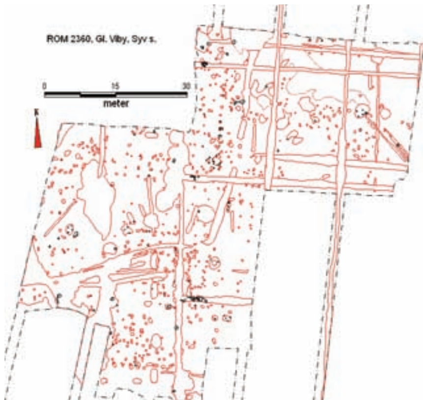
Fig. 4. Udgravningsplan.

I maj blev den egentlige udgravning iværksat. 8 Der blev afrømmet et felt på ca. 3.500 m 2 , hvor søgegrøfterne havde vist den største koncentration af anlæg (fig. 4). Den vestlige feltgrænse stødte op til grunden, der er beliggende langs Gl. Vibys landsbygade, den nuværende Vibygårdsvej.