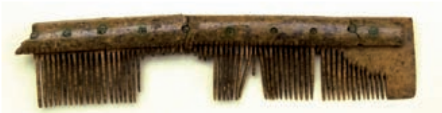
Fig. 8. Enkeltkam af ben og tak fra A372.

En nord-sydgående grøft, nogenlunde midt i udgravningen, markerer skellet mellem Gl. Vibys og Vibygårds jorder, som det fremgår af kortet fra 1796. En del af de øvrige grøfter skal muligvis ses i sammenhæng med kaptajnløjtnant C.H. Sandholts ejertid. Han købte Vibygård på auktion i 1827 og iværksatte jordforbedringsarbejder ved at mergle jorden og grave grøfter i vandlidende arealer. 13 I hvert fald er det klart, at de øst-vestgående grøfter, der i feltet og søgegrøfter ses anbragt regelmæssigt med ca. 22-23 meters mellemrum, ikke overskrider skelgrøften til landsbyens areal, men holder sig på Vibygårds jord.