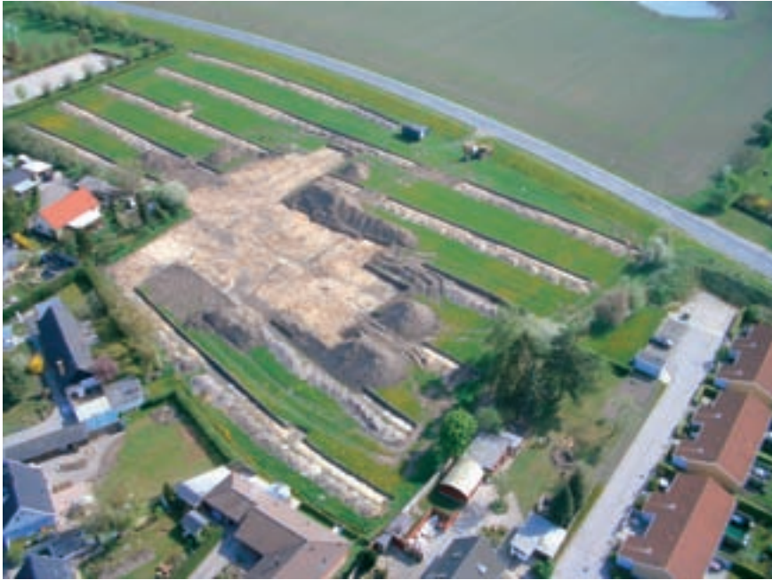
Fig. 2. Søgegrøfter og udgravningsfelt set fra sydvest.