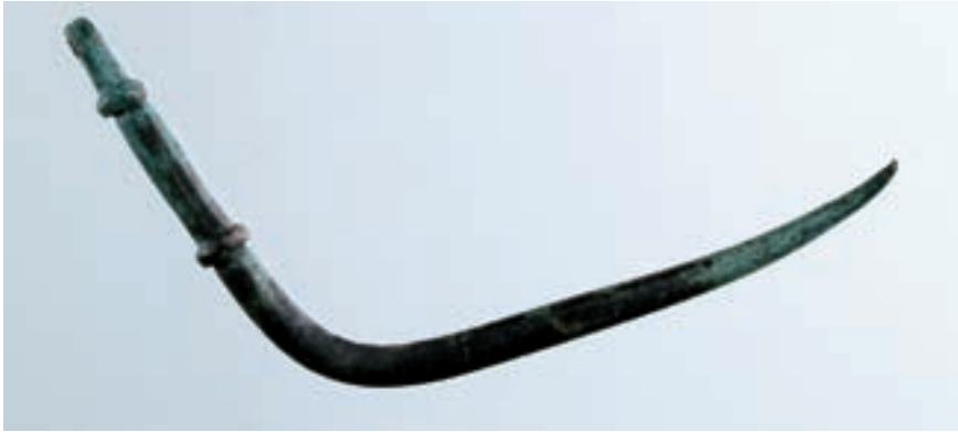
Fig. 9. Stylos fundet i pløjelaget.