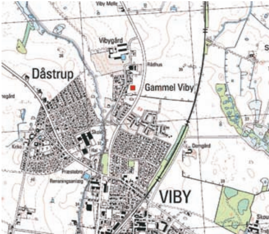
Fig. 1. Gl. Viby med nærmeste omgivelser. Udgravningens placering er markeret med rød firkant. G11-97.

ens eje i hen ved 300 år. I 1600-tallet skiftede herregården ejer flere gange, bl.a. har de to rigsråder Ove Gjedde og Otto Krag besiddet den. Vibygård var interessant for højadelens mænd, fordi den lå relativt tæt på København, hvor rigsrådet naturligvis holdt til. I sin tid lod Otto Krag en sandstenskam in bygge og forsyne med en latinsk inskription, der kan oversættes til: ”Det er med hoffet som med ilden, ikke for nær, ikke for fjern”. 5