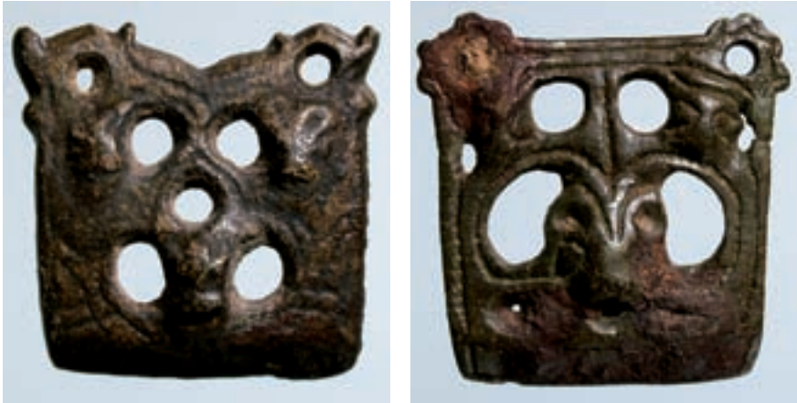
Fig. 3. Stigrembeslag af bronze. (op \times 1 og op \times 27 )

45-46 m o.h., mens landsbyen ligger 5-10 m lavere. Øst for Gl. Viby falder terrænet svagt mod bækken og vådområderne ved Syv Holme.