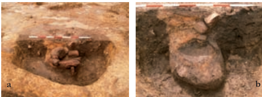
Fig. 6. Ovn i brønden (A316) under udgravning. Rester af en øvre stempakning (a) og den sammenklappede ovnkappe ses i profilvæggen, mens den grå, skålførmede ovnbund ses midt i billedet (b).

1,1 m dybt bestod fyldet af tørv med træstykker indlejret. Fundene fra brøndfyldet var fåtallige men kronologisk vidtrækkende. Materialet fremkom overvejende i den øverste halve meter, og omfattede østersøkeramik fra 10.-12. årh., enkelte skår af gråbrændt og rødbrændt glaseret keramik fra 12.-14. årh. samt lerkarskår fra 15. årh. Hertil kom enkelte dyreknogeter, en klump af forglaset ler og lidt trækul. Dybt i brønden, i tørvelaget, fandtes et sortbrændt skår med nopret overflade, der desværre er vanskeligt at datere nærmere. Der synes dog ikke at være tale om vikingetid, men snarere ældre middelalder.