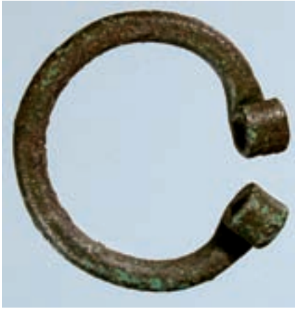
Fig. 7. Hesteskoformet spænde fra A552.

blev fundet i forbindelse hermed, er der tale om begivenheder i sen middelalder eller renæssance.